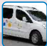
Secretaria Vamos até Si