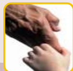
Outros Serviços e Apoios de Proximidade