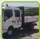
Aljustrel Limpa e Responsável pelo Ambiente